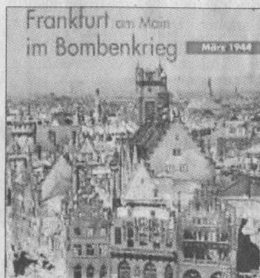
Hält Geschichte fest: Das Dokument über den Bombenkrieg.