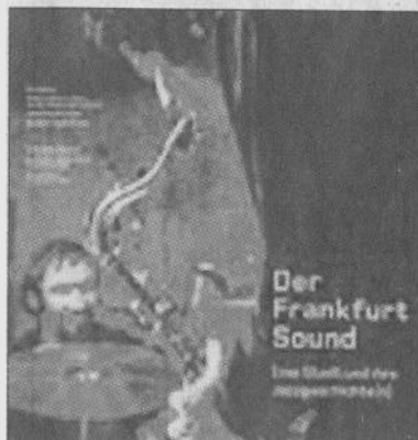
Fundgrube für alle Jazzfreunde: Kitzen Schneiders neues Buch.

Petra Schwerdtner, „Kunst vor der Haustür“, 140 Seiten, ISBN 3-00-012230-3. 22,90 Euro.